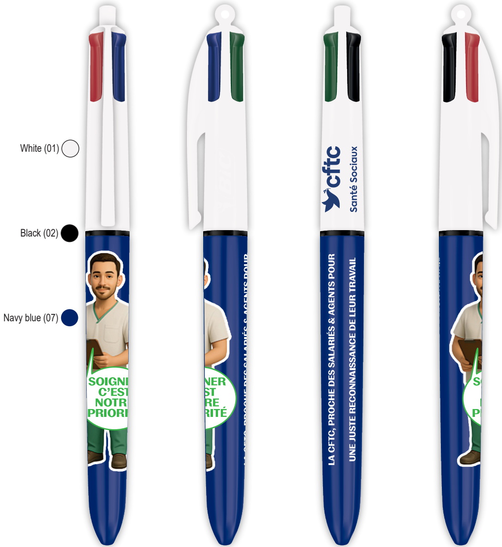
Image area: 37,5 x 62 mm. Cutting area: 36 x 62 mm. Text area: 34,5 x 60 mm.