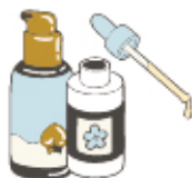
SÉRUM ANTI- ACCIDENT